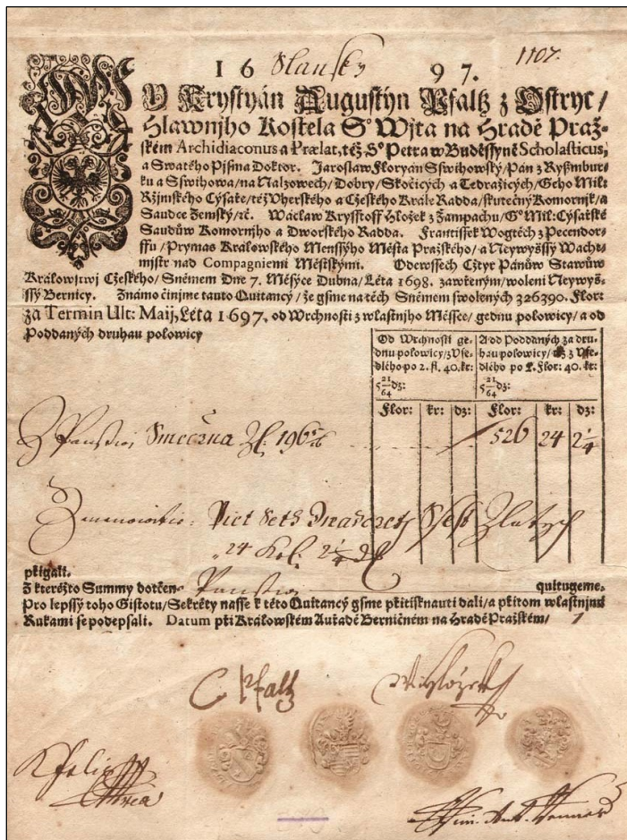
A2550 - Dluhopis Sněmu Království Českého vydaný 1. 10. 1698 v Praze

A2545 – Státní dluhopis Československa vydaný 2.3.1926 v Praze >